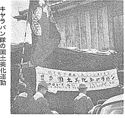
キャラバン隊の国土美化運動