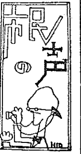
締切 毎月二十日 宛先 広報委員会