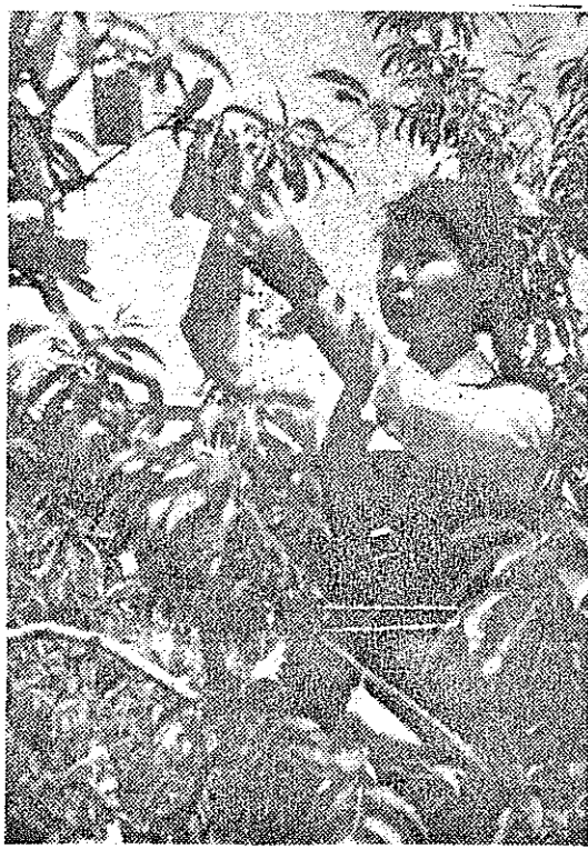
初夏の呼び声……水蜜桃の袋がけ

さき教育長ヒ免へと踏み切つたが、責任は市長だけだ。教員にも議会にもある。 南国市の教育事情は特殊な環境下にあり、教委と解放同盟あたりとは前からの感情的の累積もあつて、いづかか必然に起つべきことが四月の教員移動が端となつてあらわれたと考へられるが、そうした複雑な状況下に対処すべき正當な判断と行動を市教委が誤つたと考へられる。 何事によらず真摯な情をもつて納得のいくまで話し合うことが解決策の根本であるのに、市教委は父兄側と話し合いの場を持つてこゝろを逃したようであるが、これが第七案云々の重要点でもあるが、これでは解決のしようがあるまい。自分達だけでいくら合意をした所で先方の意思に通じはしないのである。真摯な情を尽くし積極的な努力をなすおそれなかつたら教委は責任上自発的辞任という事になつたのだらうが有名になつた教育長ヒ免問題はよりましである。