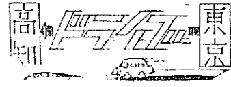
空 鉄 (完)