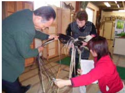
調査鶏の尾の測定状況

黒柏は小国とは遠い遺伝的関係を示し、形態観察に基づく従来の説(小穴, 1951)とは異なるものであった。地頭鶏と薩摩鶏は近い遺伝的関係を示し、従来の説を支持するものであった。長くて豊かな尾羽と蓑毛を有する品種、すなわち、尾長鶏、蓑曳矮鶏、