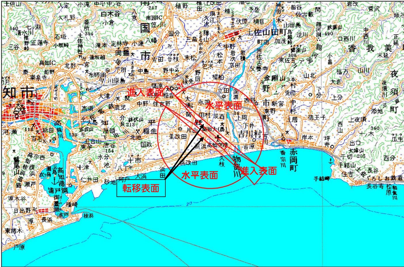
高知空港の制限表面区域図