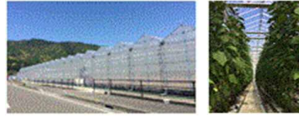
ゆめファーム全農NEXTこうち (安芸市)

オランダ型の施設、養液栽培でオリジナル品種を安定生産。出資企業のネットワークで確実な流通、契約販売が可能。関連会社にてトマトジュース等の加工品生産も実施。