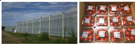
イチネン農園（日高村）

地域の最高収量を達成できる技術確立を目指し、産地の強化と後継者育成に貢献する。JAの生産部会に所属し共同出荷。