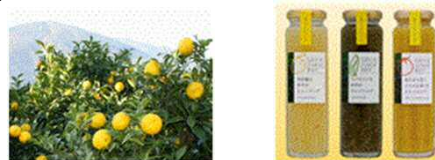
アグリネットワーク・れいほく (土佐町)

日高村、JAアース、県と連携協定を結び、地元の篤農家をアドバイザーに迎えて、栽培技術指導を受けて安定生産。