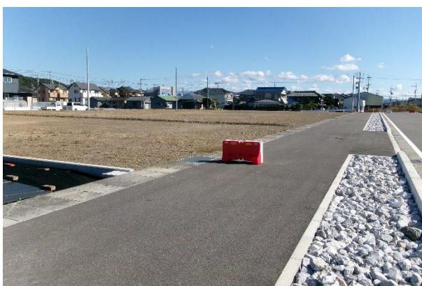
〔 第Ⅳ工区、第Ⅴ工区 〕