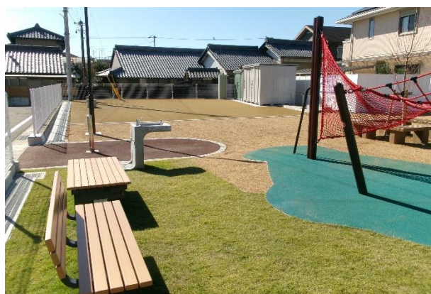
〔 2号街区公園 〕