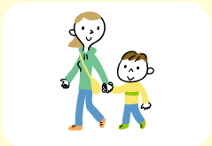
母子家庭のワコさん