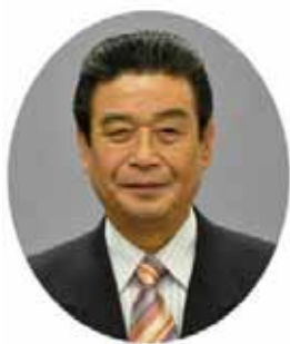
南国市長 橋詰 壽人