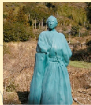
坂本神社内の龍馬像