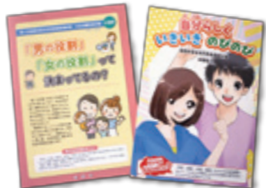
「第2次南国市男女共同参画推進計画 女性活躍推進計画」に伴う広報用パンフレット

男女共同参画社会の実現に向けて、誰もが分かりやすく理解していただけるよう大人用と子ども用パンフレットを作り、学校、関係団体に配布しました。 市役所1階、MIARE!(地域交流センター)、南国市立図書館で配布していますので、手に取ってご覧ください。