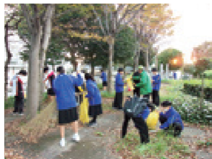
11/15 鳶ヶ池中学校・高知農業高校による清掃活動(JR後免駅前)