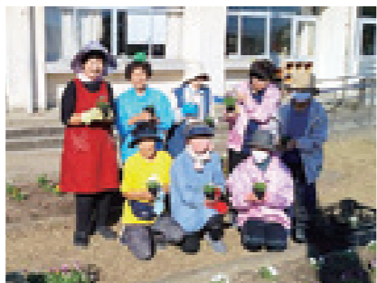
11/8 南国市更生保護女性会大篠地区による花壇の花植え(大篠小学校)