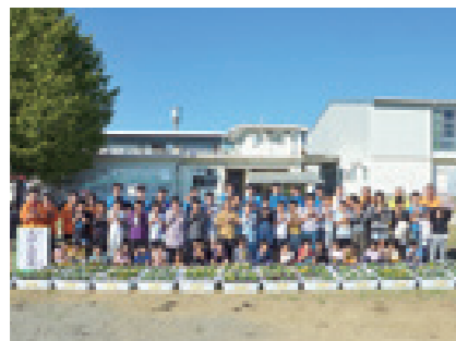
11/1 人権の花運動(日章小学校)