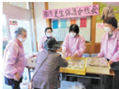
11/17 南国市更生保護女性会稲生地区によるバザー出店(稲生ふれあい館)