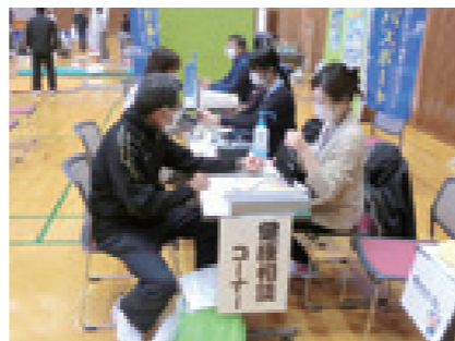
11/18 健康なんこく☆きらり☆フェア2023・まほろばクラブ南国2023秋の感謝祭(スポーツセンター)