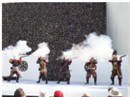
11/18 第14回長宗我部フェス(県立歴史民俗資料館)