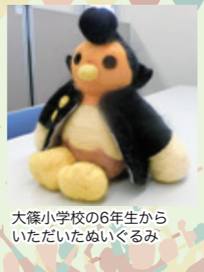
大篠小学校の6年生からいただいたぬいぐるみ