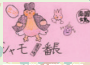
津野町の葉山小学校の4年生からいただいた手紙