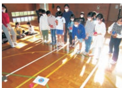
▲ 11/21 ボッチャ(パラスポ)体験教室(長岡小学校)