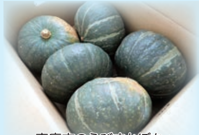
恵庭市のえびすかぼちゃ