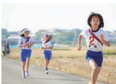
▲ 11/12 小学生駅伝大会(前浜)