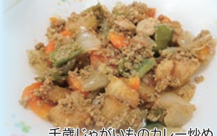
千歳じゃがいものカレー炒め