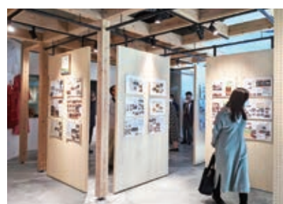
▲ 11/20~27 南国市国際交流協会設立20周年記念パネル展(MIAREI)