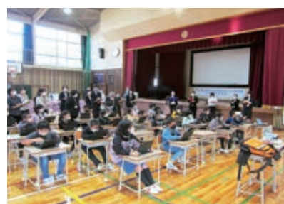
▲ 11/4 英語教育改善プラン研究発表会(日章小学校)