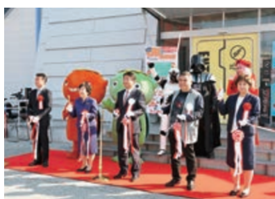
▲ 11/12,13 高知アニメクリエイター祭(海洋堂SpaceFactoryなんこく)