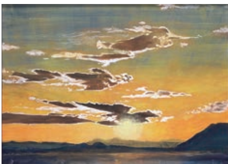
■特選 「夕日に急げ」 中沢猛男(十市)