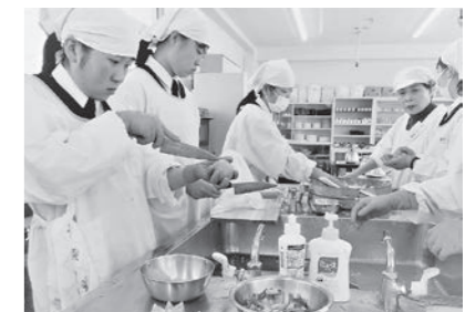
▲ 12/4 郷土料理伝承会(高知農業高等学校)