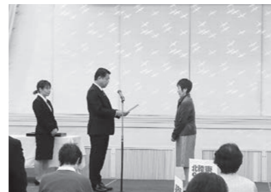
▲ 12/3 民生委員・児童委員委 嘱状伝達式(グレース浜すし)