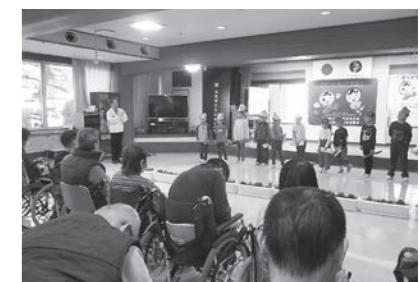
▲ 12/10 国府小学校2年生「人権の花運動贈呈式」(こくふ)