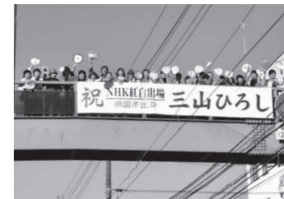
▲ 12/3 三山ひろし紅白歌合戦出場記念 応援横断幕掲示(市役所前歩道橋)