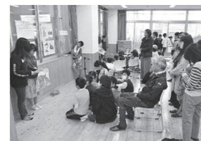
▲ 12/12 楽しく学べる防災フェスタ(後見町防災コミュニティセンター)