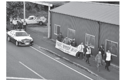
▲ 12/3 合同年末非行防止街頭パレード(大塚・南国バイパス)