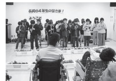
▲ 12/6 長岡小学校4年生「人権の花運動贈呈式」(土佐希望の家)