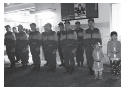
▲ 12/27 年末警戒(奈路)