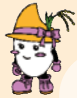
南国市食育キャラクター まいちゃん