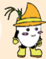
南国市食育キャラクター こめおくん