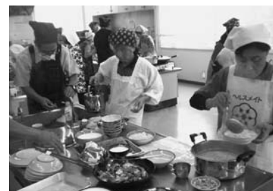
▲9/29 脳のいきいき教室 (保健福祉センター)