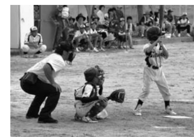
▲9/6 第18回南国市長杯小学生野球大会 (スポーツセンター)