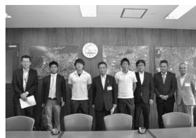
▲9/18 高知UトラスターFCが四国リーグ優勝報告 (市役所)