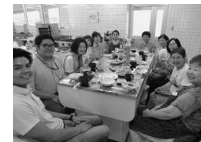
▲9/7 外国料理教室 (三和防災コミュニティーセンター)