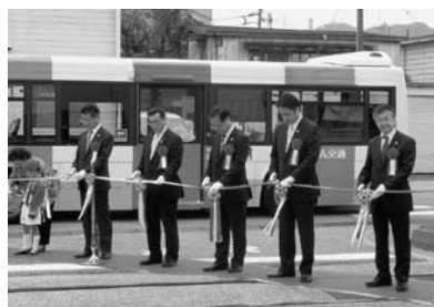
▲10/1 とさでん交通(株)設立記念セレモニー (とさでん交通)