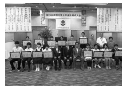
▲9/6 第29回南国市青少年健全育成大会 (グレース浜すし)