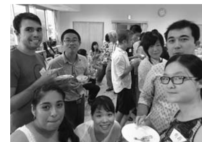
▲9/7 国際交流ポットラックパーティー (三和防災コミュニティーセンター)