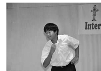
▲9/5 第17回南国市中学生英語弁論大会 (保健福祉センター)