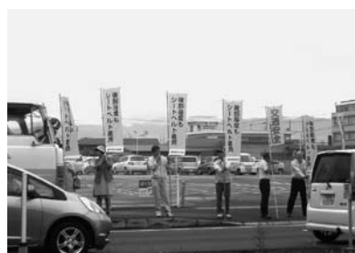
▲9/22 秋の交通安全運動人間看板 (大涌交差点)