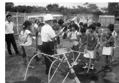
▲9/18 久礼田小学校4年生「水の学習」 (大篠配水池)