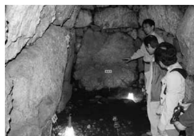
▲9/21 芝の前1号墳現地説明会 (岡豊町定林寺)