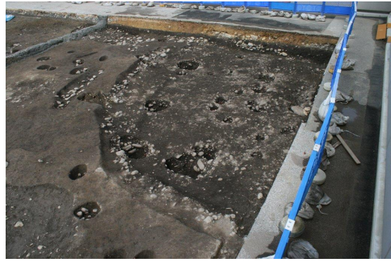
特大型住居完掘状況