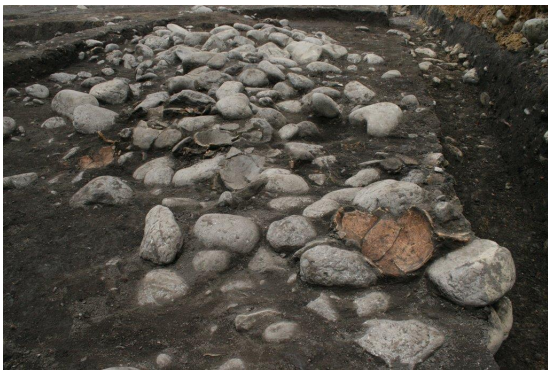
特大型住居 石・土器出土状況