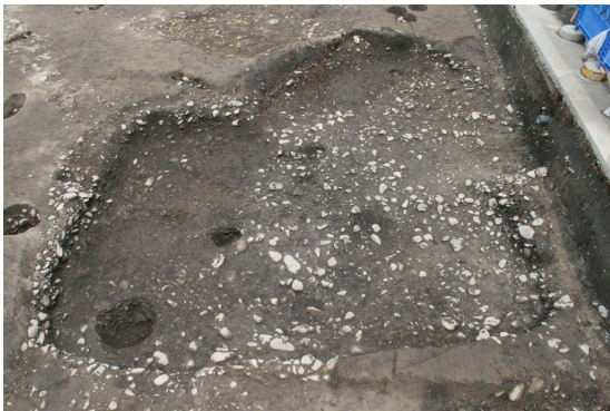
竪穴住居完掘状況