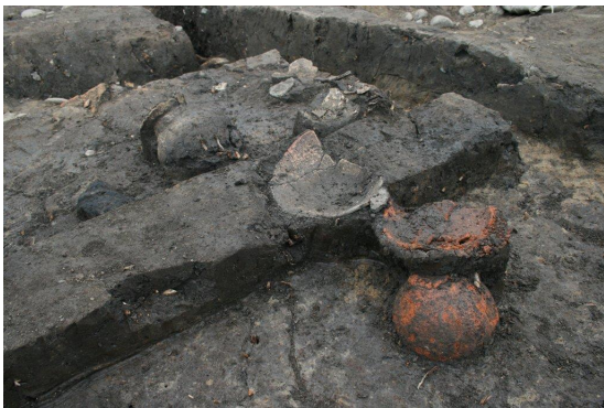
竪穴住居内土器出土状況