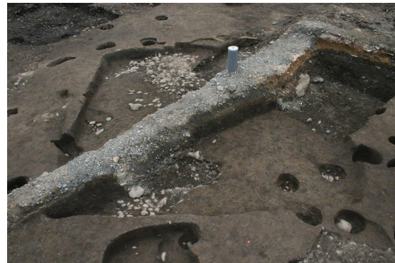
竪穴住居完掘状況