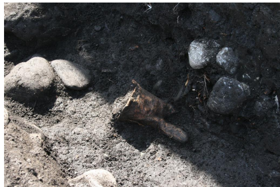
土製支脚出土状況