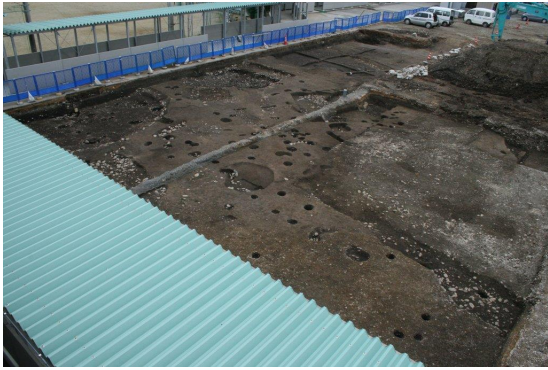
東調査区完掘状況