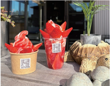
↑期間限定販売のアイスクリーム