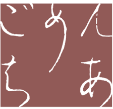
Nankoku City Library GOMENCHIA