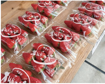
↑朝どれの新鮮なイチゴが店頭に並び

販売シーズン中は朝どれの新鮮なイチゴが店頭にてますので、本当に美味しいイチゴが堪能できます。販売のタイミングや定休日は変動しますので、Instagramにて情報を確認してください。(お電話でも大丈夫です)