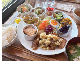
↑ボリューム満点のバランスあるランチ。

製のコップ「ククサ」から付けられ、お店のコンセプトでもある「カップ一杯分でも幸せを感じていただきたい」というオーナーの思いが込められています。病気とも戦いながら現在18年も続いているお店、お客様の層は昔は地元の方が多かったものの、SNSや口コミで現在は岡山や長崎など県外のお客様もおられるそうです。お食事は日替わりのランチのみ、ボリューム満点なので必ずおなかを空かせて来店してください！高知県産の食材を使ったバランスの良いメニューとなり、朝の3時半から仕込みが入るランチは移住担当者も納得のいく美味しさと満足感でした！今は土日だけの限定営業となっておりますので必ず予約をお願いします。日替わりのメニューはInstagramにて情報を発信していますのでぜひご覧ください。