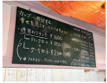
↑ランチ以外でも各種ドリンクと手作りケーキもあります。