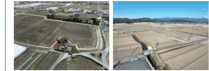
堀ノ内工区整備後 浜改田西部工区整備後

令和7年度は浜改田西部工区約22.3ha及び堀ノ内工区約2.6haのほ場整備工事が完了しました。 令和8年度は両工区に加えて、新たに廿枝工区の工事に着手する予定としており、その他の工区においても順次設計作業や工事の着手に向けて準備を進めてまいります。