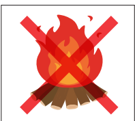
屋外での火遊び・たき火