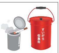
たばこの吸い殻など残り火の確実な処理