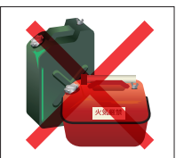
可燃物付近での喫煙