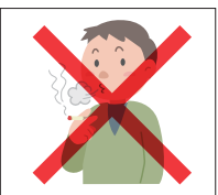
市長が指定した区域での喫煙