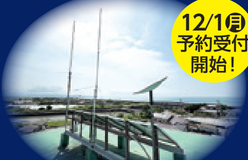
南国市津波避難タワーの屋上に設置された中継局アンテナ