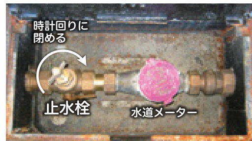
時計回りに閉める