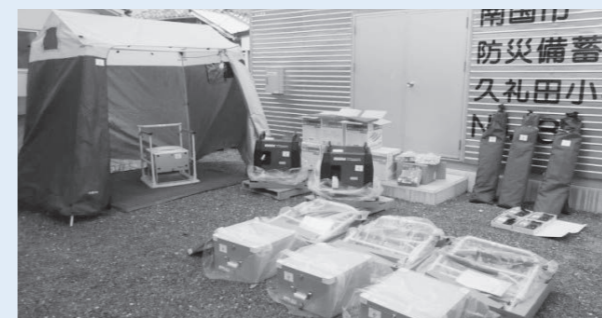
■問い合わせ/企画課企画調整係 ☎880-6553

こうした取り組みの中で、災害時の避難所における課題解決のため、宝くじコミュニティ助成事業を活用して災害用トイレとトイレ用テントセット、発電機を整備しました。