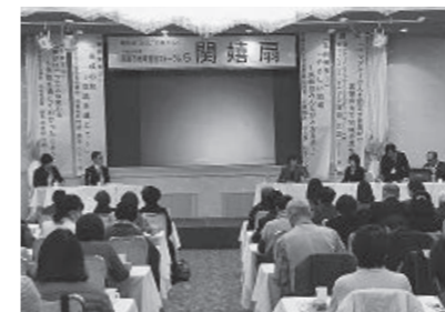
▲ 3/10 南国市地域福祉フォーラム「関嬉扇」の開催(グレース浜すし)