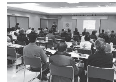
▲ 3/5 日本赤十字社高知県支部南国市地区大会の開催(保健福祉センター)