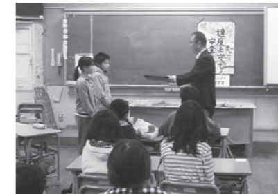
▲ 3/5 南国~大豊間開通30周年記念イベント感謝状授与(久礼田小学校)