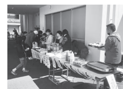
▲ 3/17 こども食堂ごめんケッキング~2018春まつり~(後免町防災コミュニティセンター)