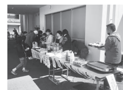
▲ 3/17 こども食堂ごめんケッキング～2018春まつり～(後免町防災コミュニティセンター)