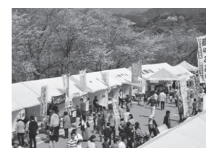
▲ 3/31、4/1 岡豊山さくらまつり(県立歴史民俗資料館)