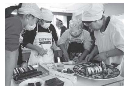
▲ 2/23 郷土料理講習会 (後免野田小学校)