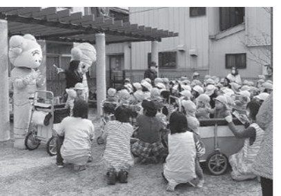
▲ 2/22 やきいもグーターパーティ (後免町防災コミュニティセンター)