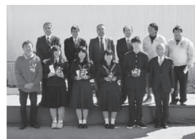
▲ 2/11 ハガキでごめんなさい表彰式 (後免町商店街)