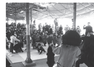
▲ 2/3 第22回地域安全祈願節分まつり (土曜日)