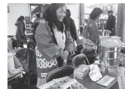
▲ 2/6 なんこく野草茶フェア (道の駅南国風良里)