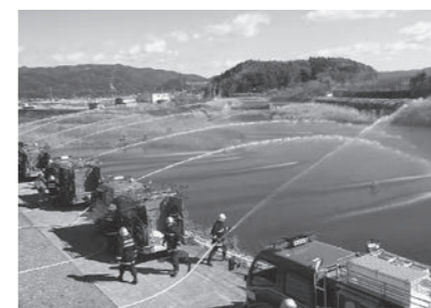
▲ 2/4 一斉放水訓練(国分川)