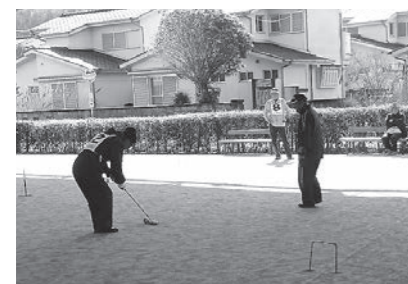
▲ 2/17 第29回南国市長杯ゲートボール大会 (あけぼの公園)