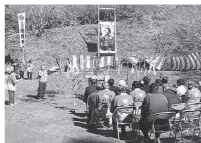
▲ 2/11 才谷龍馬先祖祭り (才谷龍馬公園)