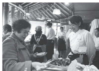
▲ 2/20 農家レストランまほろば畑彩グループ&岡豊高校コラボレストラン(道の駅南国風良里)