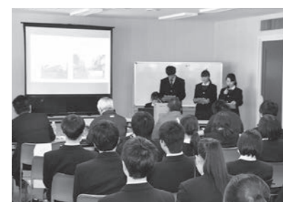
▲ 2/7 市長へのまちづくりアイデア提言 (市役所)