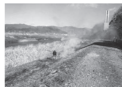
▲ 2/4 国分川シバ焼き(国分川)