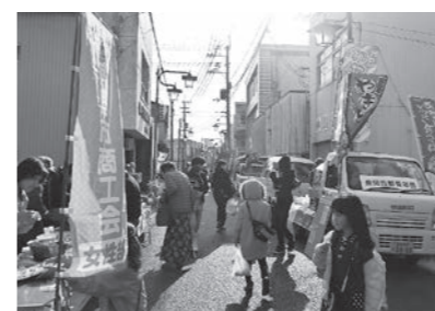
▲ 2/11 軽トラ市(後免町商店街)