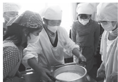
▲ 2/16 豆腐作り講習会 (後免野田小学校)