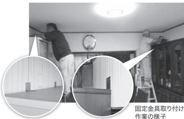
固定金具取り付け作業の様子