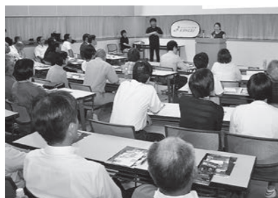
▲ 8/18 異文化教室シンガポールを学ぼう! (スポーツセンター)