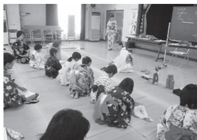
▲ 8/5 親子教室～浴衣に親しもう～ (大篠公民館)