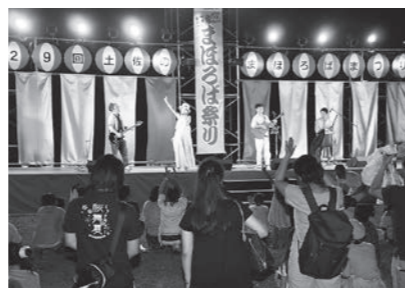
▲ 8/5 まほろば祭り (吾岡山文化の森)