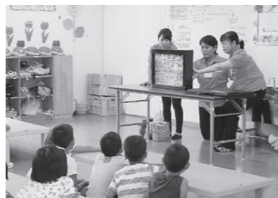
▲ 8/9 女性消防団員による防災啓発 紙芝居の読み聞かせ (ひまわり学童)