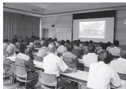
▲ 8/30 南国市消防本部職員研修会 (消防本部)