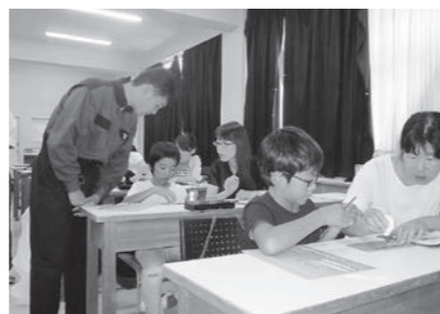
▲ 8/11 高知東工業高校開放講座「グライダーを作って飛ばそう」 (県立東工業高校)