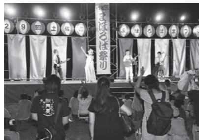
▲8/5 まほろば祭り (吾岡山文化の森)