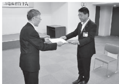
▲ 8/9 南国市長当選証書授与式 (市役所)