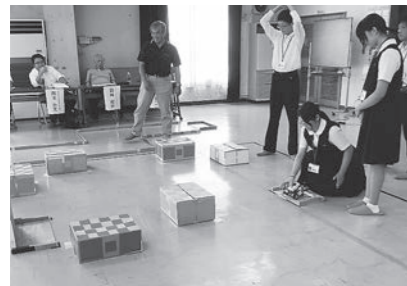
▲8/10 第16回からくり半蔵垣内 ロボット選手権 (大篠公民館)