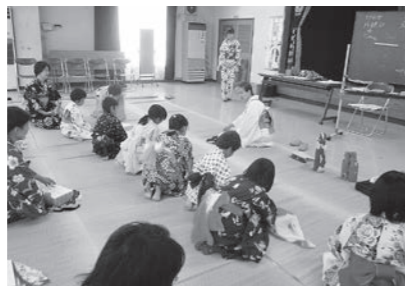
▲8/5 親子教室～浴衣に親しもう～ (大篠公民館)