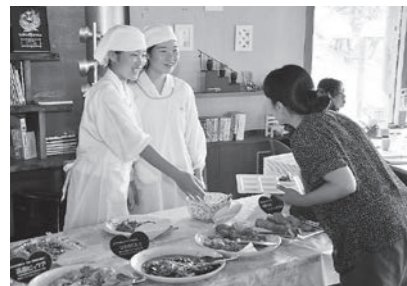
▲8/8 高校生レストラン (道の駅南国風良里)