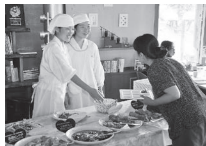
▲ 8/8 高校生レストラン (道の駅南国風良里)