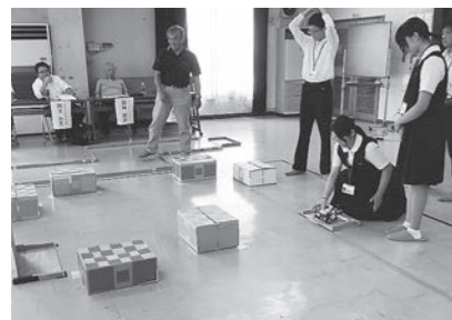
▲ 8/10 第16回からくり半蔵垣内 ロボット選手権 (大篠公民館)