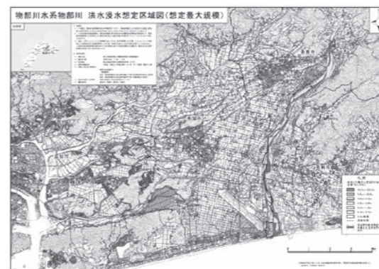
物部川・仁淀川浸水想定区域図 http://www.skr.mlit.go.jp/kochi/work/monobe_niyodo_flood.html